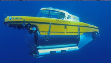
Tauchboot LULA 1000 auf Fahrt. Stiftung Rebikoff- Niggeler Faial / Azoren

Bei dem Siegburger Pumpwerk handelt es sich hier aber nicht um das bekannte Veranstaltungshaus des Kunstvereins Rhein-Sieg, das in Siegburg an der Bonner Straße 65 steht, sondern um ein Kunstobjekt gleichen Namens, das der Kölner Künstler Tom Koesel gefertigt hat.