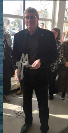
Sebastian Schuster Landrat des Rhein-Sieg-Kreises